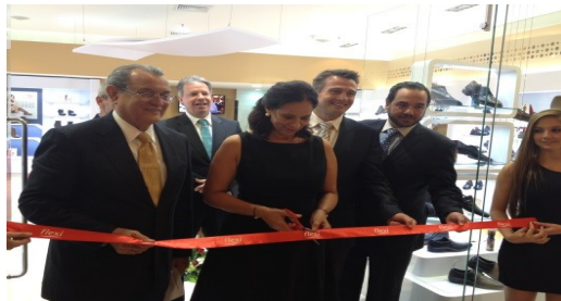
Inauguración de la Tienda Flexi Currida-

Para mayor información consulte: Comunicado PostForo , Galería Fotos y Presentaciones expositores .